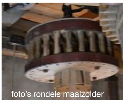
foto's rondsels maalzolder

Op de Open Monumentendag op zaterdag 14 september a.s., is de molen open voor het publiek, echter de molen zal niet draaien ivm onderhoudswerkzaamheden.